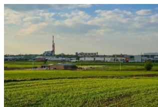
Tychy, región industrial de Silesia